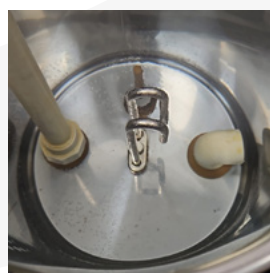
KalyxX 100 處理後無水垢沾附