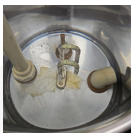
未經處理水垢沉積