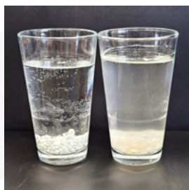
▶ 水處理 12 小時後效果比較圖： 左側為 KalyxX 100 mini 處理效果(清澈透明)，右側為聚磷酸鹽處理效果(混濁不透明)